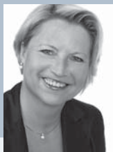
Cornelia Pieper MdB, stv. Vorsitzende des Bildungsausschusses des Deutschen Bundestages