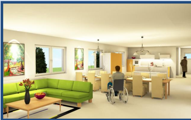
Ansicht von Innen

Neben potentielle Mitbewohner mit Verwandten, Anwohner, Pflegepersonal, Apotheker, Investoren und vor allem auch Journalisten herzlich Willkommen.