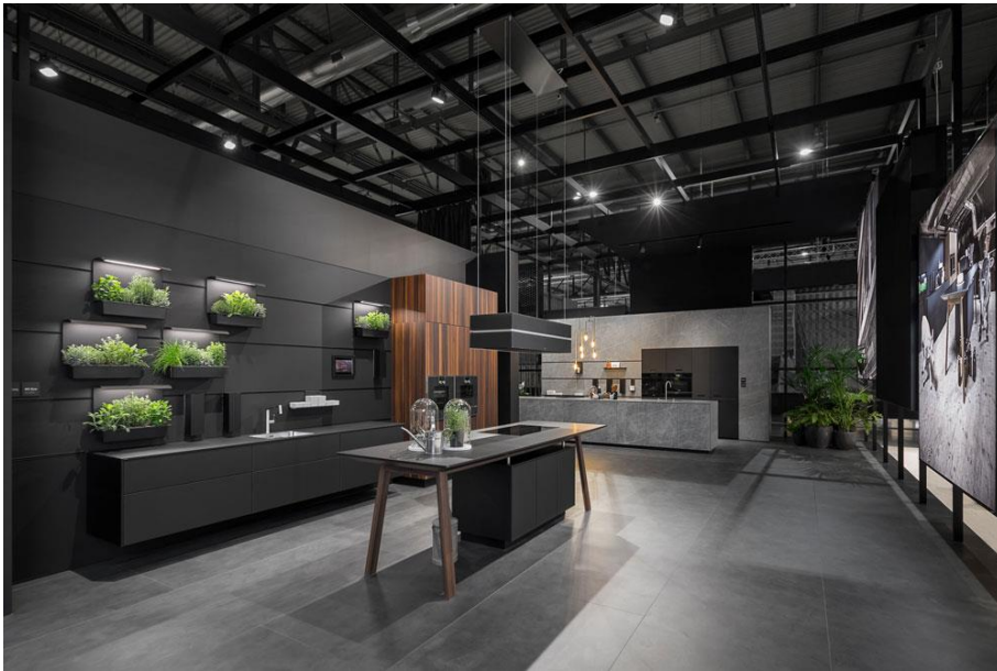
IMG_6198: Ausdrucksstark: Die Premium-Küchen von next125 werden vor schwarzem Hintergrund in unterschiedlichen Settings emotional als Lebensraum präsentiert.