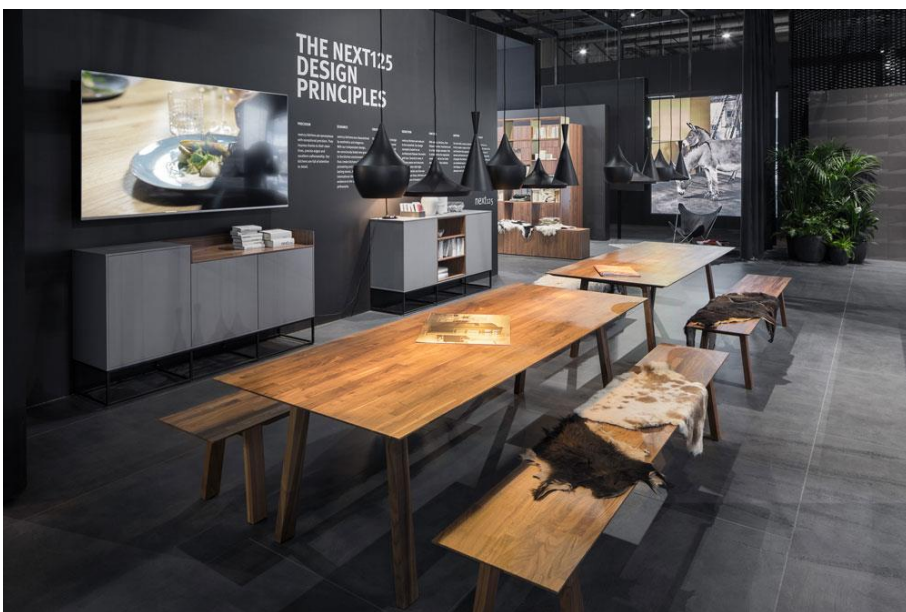
IMG_6004: Atmosphärische Beleuchtung und die Integration der next125 Kampagnenmotive mit Tieren beleben den Stand visuell und verstärken das Eintauchen in die Markenwelt.