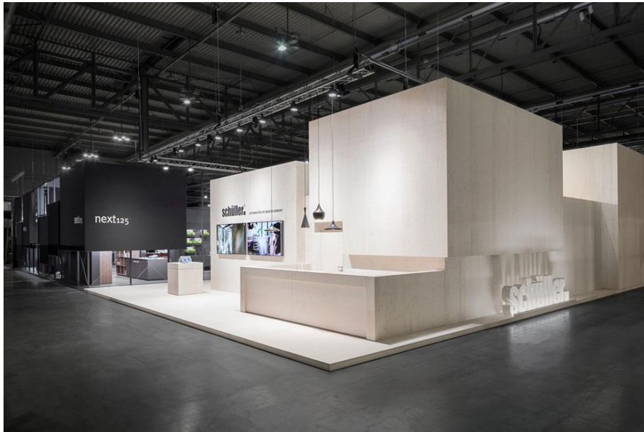
IMG_6160: Ein Auftritt für zwei Schüler-Marken: Schüler.C in weiß lasiertem Fichtenholz, die Premiummarke next125 in schwarz gepulverten Aluminiumstrukturen.