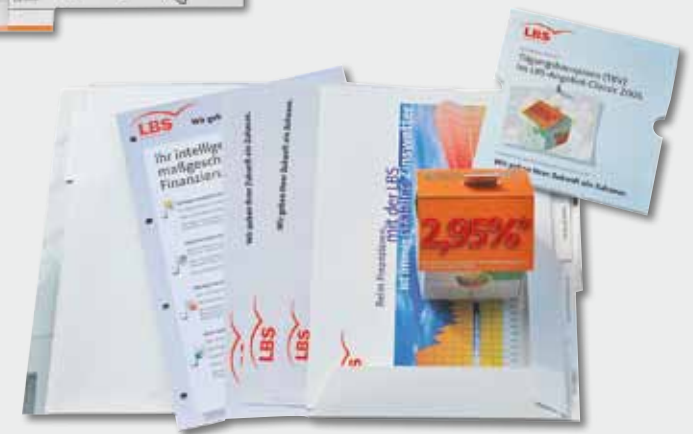
LBS Mappe mit Klettverschlussklappe und eingebundenen Registerteil Besonderheit: Brillantlack Glanz außen, Klettverschluss, Register mit Laschen und Taben