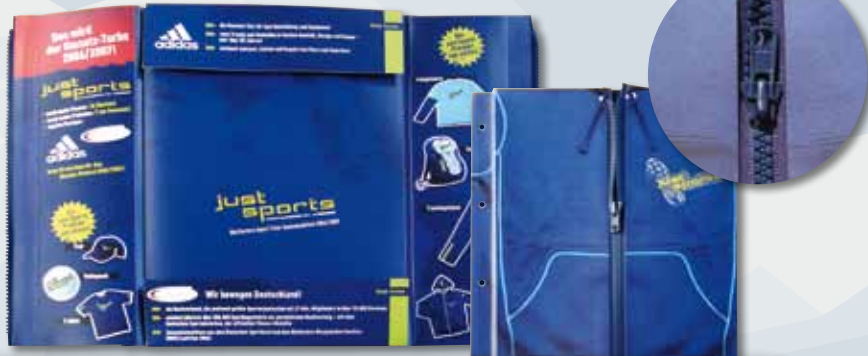
ADIDAS Reißverschlussmappe Besonderheit: funktionelle Einarbeitung des Reißverschlusses einer Sportjacke in eine Altarfalzmappe

Zu unseren Kunden zählen Global Player aus allen Industriezweigen, Agenturen und mittelständische Unternehmern, aber auch Kommunen, Verbände und Ministerien.