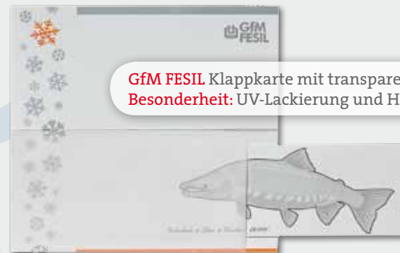
GfM FESIL Klappkarte mit transparenter Lasche Besonderheit: UV-Lackierung und Hochprägung, personalisierter Gutschein